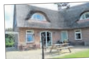
De Heerlyckheid van Texel Ruigendijk 27, De Koog, 0222 317112

Standaardkamer voor twee €100 per nacht, inclusief ontbijt. Kamperen: €35 per nacht. heerlijkheidtexel.nl